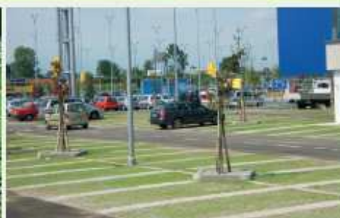
Vulcapark per PARCHEGGI VERDI Vulcapark for GRASS PARKING LOTS