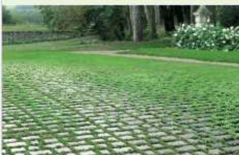
Vulcapark per PARCHEGGI VERDI Vulcapark for GRASS PARKING LOTS