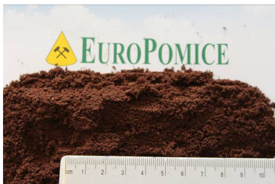
Sabbia di Lapillo 0-3