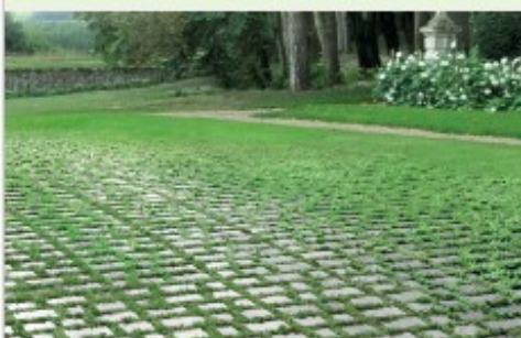
Vulcapark per PARCHEGGI VERDI Vulcapark for GRASS PARKING LOTS