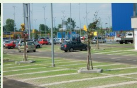
Vulcapark per PARCHEGGI VERDI Vulcapark for GRASS PARKING LOTS